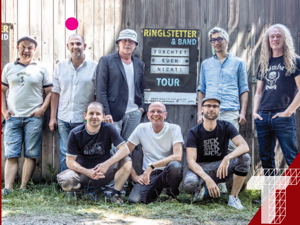
Titelbild © Martina Bogdahn