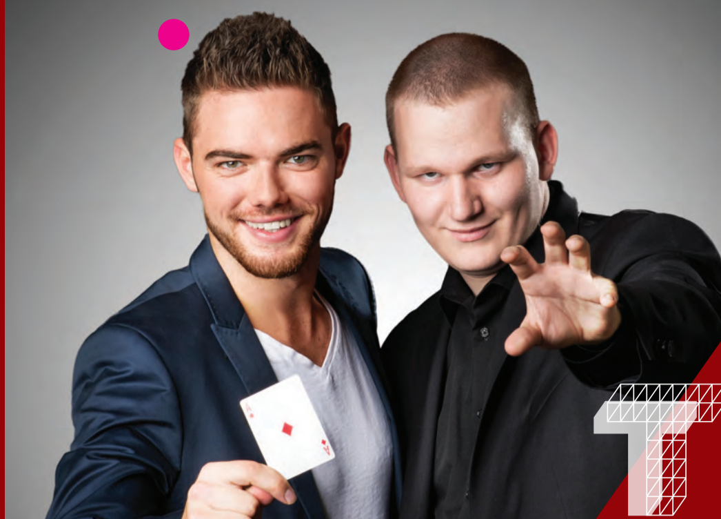
Titelbild © Ben David & Christo